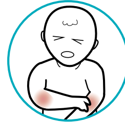
ቃንዛ ጭዋዳታትን መላግቦታትን