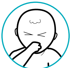
ዕግርግር፣ ተምላስን ውጽኣትን

ድሕሪ ክታቦት ንፍዮ፣ ጽግዕን ንፍዮ ጀርመንን (MMR) ፍሮማይን ረስኒ፣ ዕንፍሩርን ከምኡ'ውን ካልኣት ጎድናዊ ሳዕቤናትን ድሕሪ ክታቦት ክብ 1-2 ሰሙናት ኣቢሉ ከጋጥም ይኸእል ኢዩ።