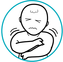
ረስኒ፣ ቀራ-ቀራ ምባልን